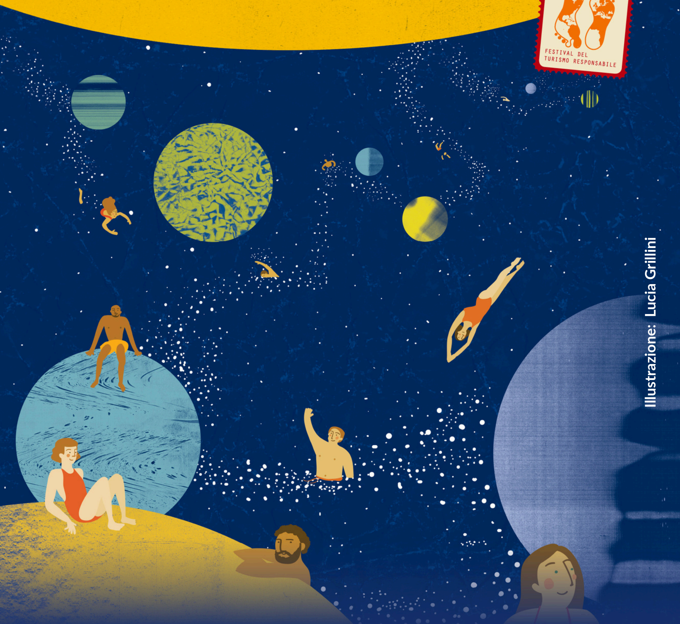
Illustrazione: Lucia Grillini