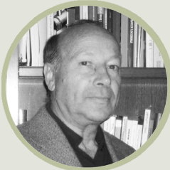
PIERO BEVILACQUA Storico, scrittore e saggista lectio magistralis

I paesaggi rurali esprimono molto bene la situazione odierna di incertezza, trasformazioni sociali ed economiche. Attraverso una narrazione di esempi virtuosi o problematici, verranno raccolti e presentati i progetti di paesaggio attorno alle agricolture mediterranee, minacciate dai cambiamenti climatici e dall'abbandono, mutevoli e al tempo stesso identitarie.