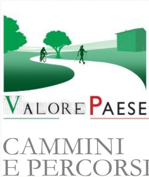
Il portafoglio immobiliare 2017